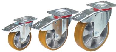
71312 / 71313 / 71314