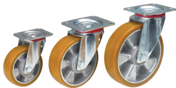
71302 / 71303 / 71304

Veja no ficheiro “Especificações Rodas” os detalhes técnicos deste tipo de rodas.