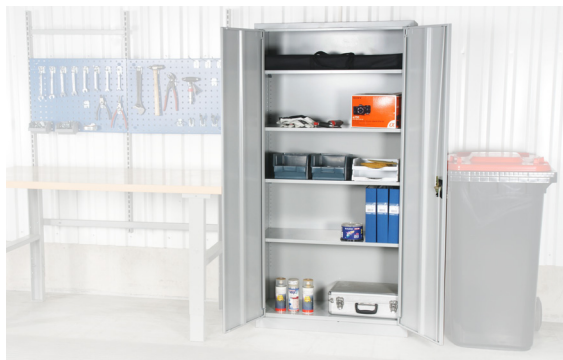
Ideal para arquivo em escritório ou para armazenar ferramentas em armazém