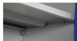
4 Prateleiras ajustáveis em altura