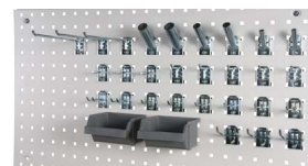
Exemplo de Utilização