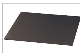
Acessório 74358 Tapete antiderrapante