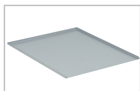
Acessório 74355 Placa para topo