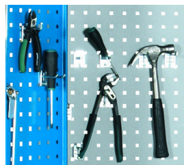
Painéis perfurados para suspensão de ferramentas