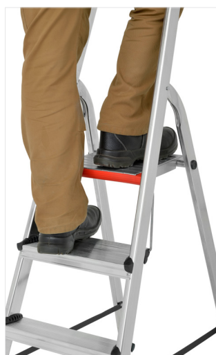
Degrau duplo acresce conforto ao utilizador

Número de degraus inclui a plataforma / topo