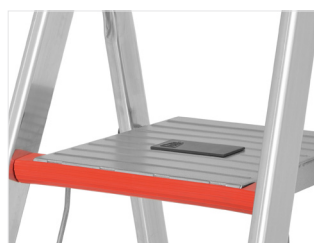
Conceção ergonómica da plataforma com estriado e rebordo frontal em borracha para evitar deslizamento