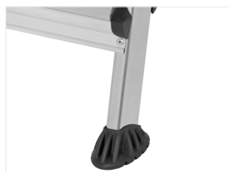
Pés antiderrapantes para aderência ao pavimento