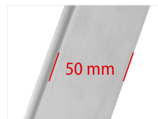
Perfil reforçado de 50 mm confere maior estabilidade e vida útil mais longa do escadote