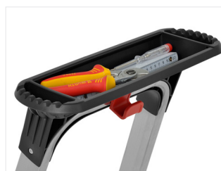
Compartimento espaçoso para acondicionar ferramentas , mesmo na posição fechada