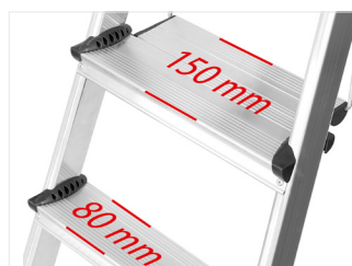
Degrau duplo com 150 mm de profundidade proporciona maior conforto na subida e descida