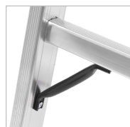
Reforço sob 1º degrau