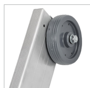
Rodas de topo