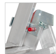
Detalhe da articulação