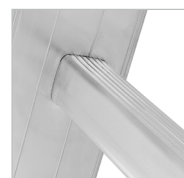
Detalhe do degrau