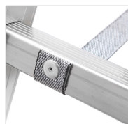
Cintas de segurança