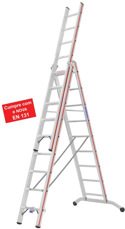
Artigo nº 604727