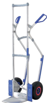
2 011 21 Em alumínio

Destaque para o carro 284 811 21 , pela ergonomia das pegadeiras CLICK4, ajustáveis em altura.