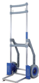
821 274 45 Em alumínio