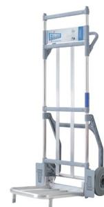
823 280 42 Em alumínio