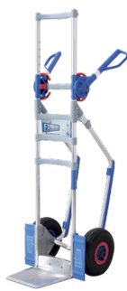
284 811 21 Em alumínio