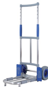
851 276 4502 Em alumínio Rebatível