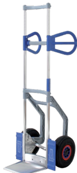
233 811 21 Em alumínio