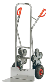
AK1327 / AK1328