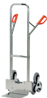
AK1325 / AK1326