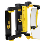
Modelo Visão reduzida