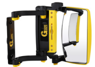
Modelo Visão alargada