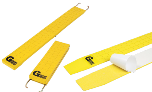
Capas de proteção