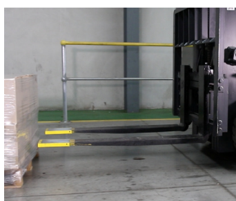
Não danificam as cargas envolvidas