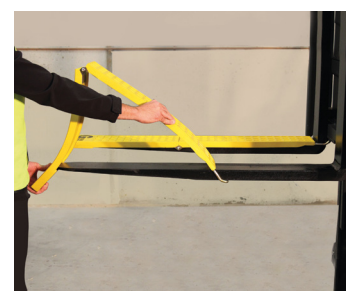
Inserção das capas nos garfos do empilhador