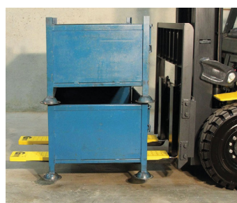
Impedem que a carga se mova durante o transporte