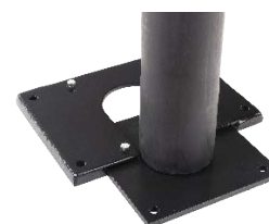
Placa Deslizante DFFS-SP