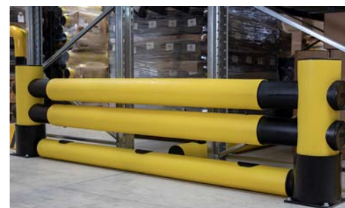
“Mike” + “Golf”