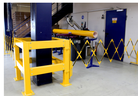
Combinação Protetor para Colunas + Barreira Extensível