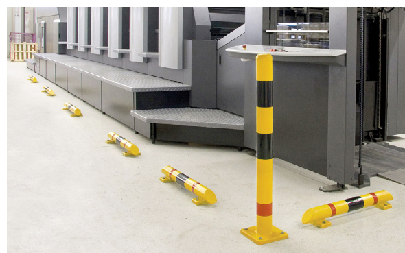
Combinação do Poste de Proteção + Barras de Proteção