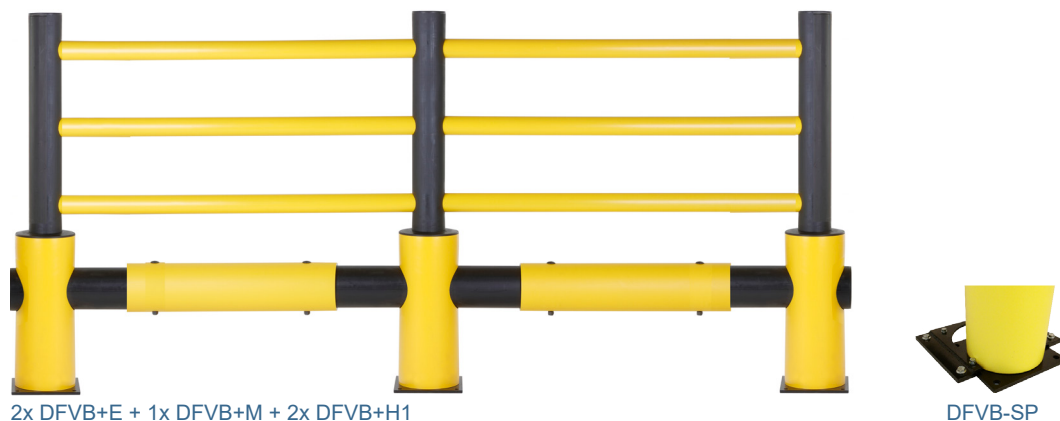
2x DFVB+E + 1x DFVB+M + 2x DFVB+H1