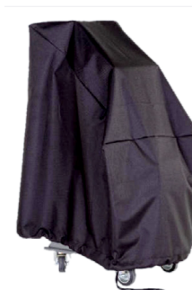
Acessório: Art. nº. KPS-SACO