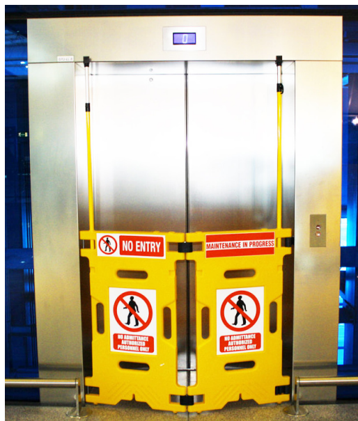
Baía na marcação de elevador em manutenção