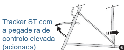
Tracker ST com a pegadeira de controlo elevada (acionada)