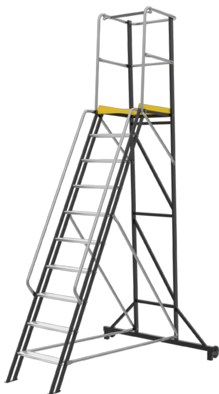
Artigo nº 806610 Plataforma Fixa Em Aço zincado e alumínio

Plataforma robusta de estrutura fixa. Ideal para trabalhos intensivos e exigentes. Plataforma na dimensão 600 x 490 mm, com proteção total . Adequada a trabalhos de longa duração, tais como: instalações, pintura, armazenagem, etc. Produto em conformidade com a Norma EN 131, parte 7.