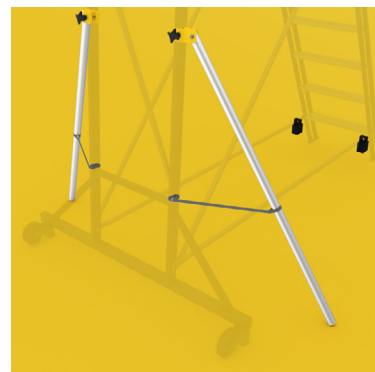
Kit de exterior (acessório), recomendado para o modelo com 12 degraus, Art. nº 806613