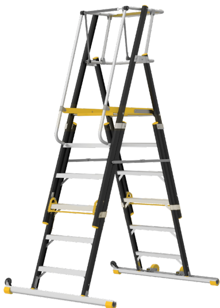
Altura ajustável Rebatível Protecção total na plataforma

Nova versão aperfeiçoada , ainda com mais Segurança : plataforma com protecção total , na dimensão 650 x 525 mm .