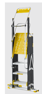
Rebatida 450 mm espessura