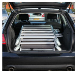
Compacta, fácil de transportar