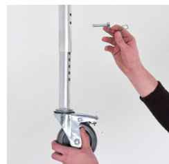
Rodízios com ajuste de altura por pino