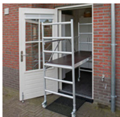
Base relativa passa por portas standard