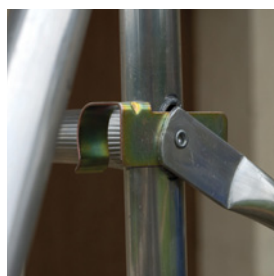
Sistema de segurança