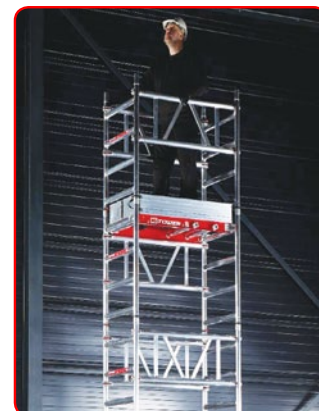
Para 1 só pessoa Poder efetuar trabalhos até 6 m