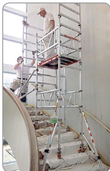
Trabalhos de pintura em desnível

✓ Utilização privilegiada em espaços confinados, devido à sua dimensão: 0,73 x 1,17 (L x C)