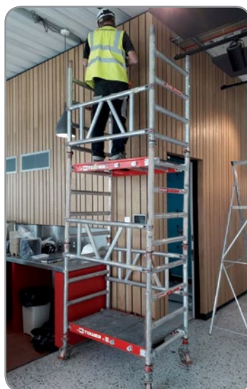
Acesso em zonas interiores