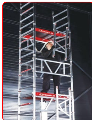
Para 1 só pessoa Instalar uma Torre com 5 m