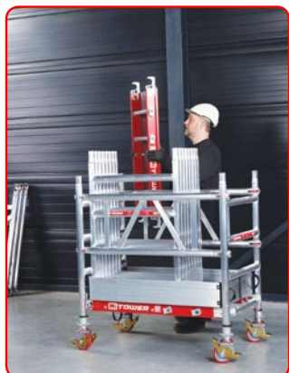
Para 1 só pessoa Descarregar e transportar