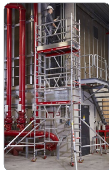
Manutenção na Indústria