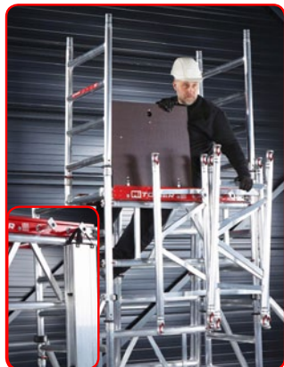
Para 1 só pessoa Montar e transpôr componentes