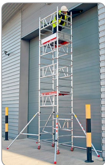
Intervenção em portão de acesso