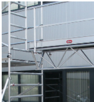
Detalhe da ligação da Torre à Ponte MTB