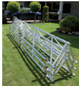
Sistema original de acondicionamento, para transporte