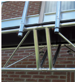
Unções de encaixe perfeitas executadas através de tubos cónicos