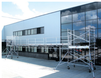
As configurações podem variar em cada país