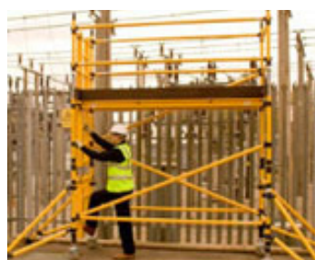
A subida é efetuada pelo interior das escadas fixadas nos bastidores