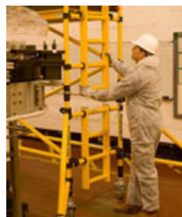
Estabilizadores conferem acréscimo de segurança