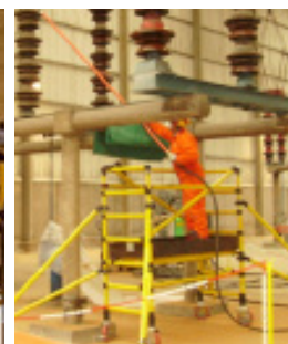
Material não condutor protege os operadores contra correntes elétricas até 220 kV