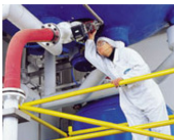
Manutenção em Refinarias , classificadas como Zona 1, confere proteção contra riscos de explosão