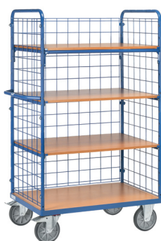
8411-1 / 8412-1 / 8413-1

Carros com 4 prateleiras, sendo 1 fixa e 3 amovíveis