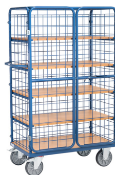
8581-3DE / 8582-3DE / 8583-3DE

Carros com 5 prateleiras, sendo 1 fixa e 4 amovíveis