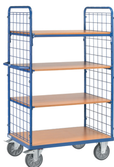
8411 / 8412 / 8413

Carros com 4 prateleiras, sendo 1 fixa e 3 amovíveis