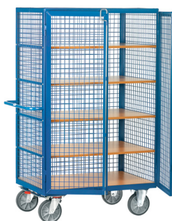
4392 / 4393 Sistema de fecho por haste