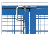
Sistema de fecho por haste Fornecido sem cadeados