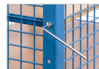
Suporte para prateleiras Amovível. Distância de 100 mm