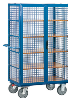
5392 / 5393 Fecho cilíndrico