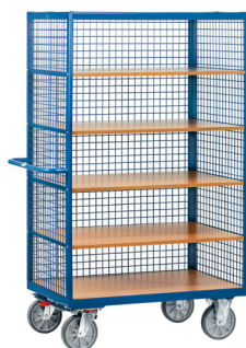
3392 / 3393

Nestes Carros o sistema central de travagem TOTALSTOP está incluído.