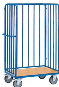
8381-1 / 8382-1 / 8383-1