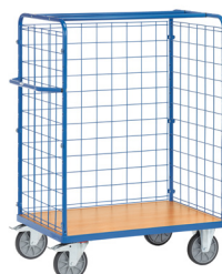
8481-1 / 8482-1 / 8483-1