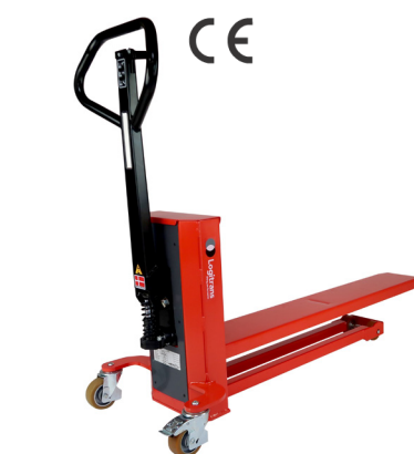
Modelo DLQ 200 Com pernas de suporte Maior comprimento do garfo