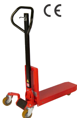
Modelo LogiQ 200