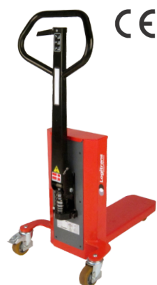
Modelo LogiQ 300 Com pernas de suporte