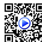
Vídeo DLQ 200