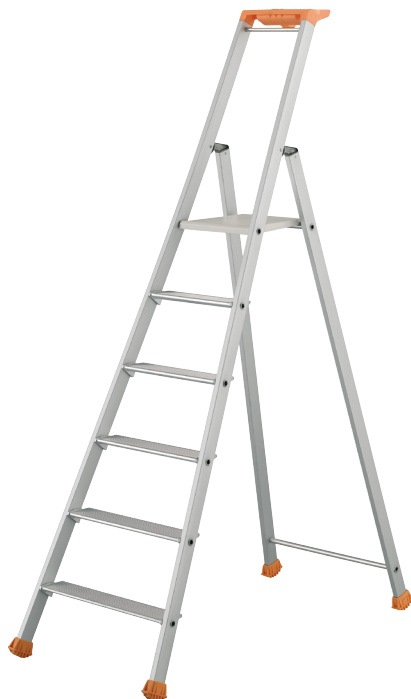
Artigo nº 2370/006 Escadote com Apoio de Pernas