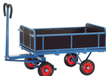
6453 V / 6454 V / 6455 V / 6456 V