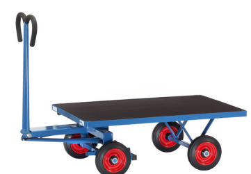
6403 V / 6404 V / 6405 V / 6406 V