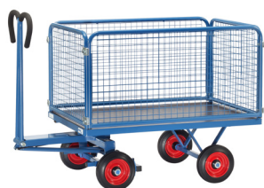
6433 V / 6434 V / 6435 V / 6436 V Guardas com 600 mm de altura