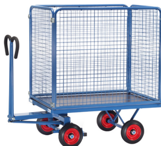
6443 V / 6444 V / 6445 V / 6446 V Guardas com 1000 mm de altura